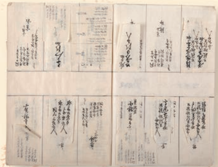
こんばんごしやうらくにつきかきあげしゆくず 文久3年「今般御上洛二付書上宿図」

〒211-0051 川崎市中原区宮内4-1-1 川崎市公文書館(TEL: 044-733-3933)