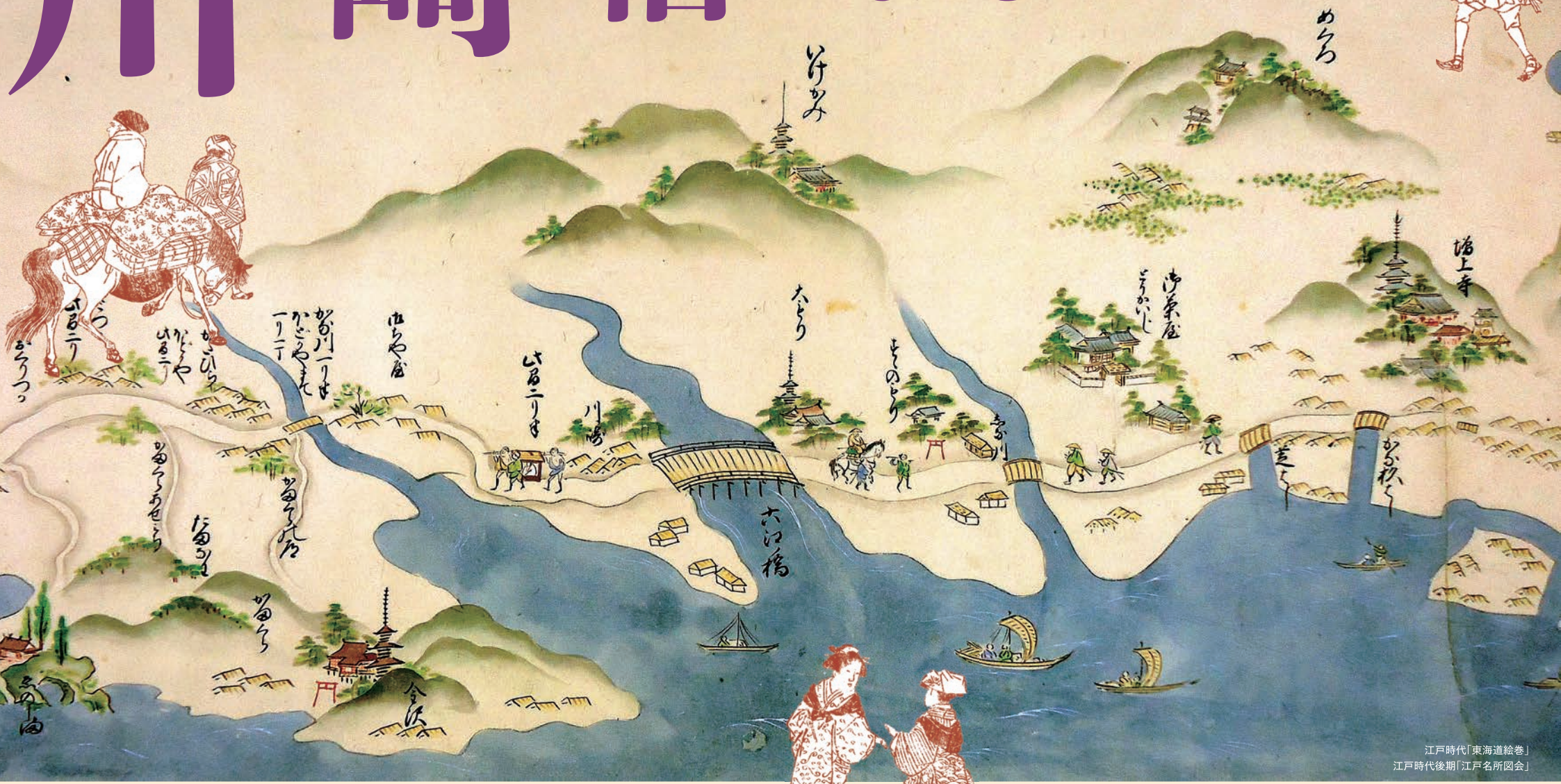
江戸時代「東海道絵巻」 江戸時代後期「江戸名所図会」