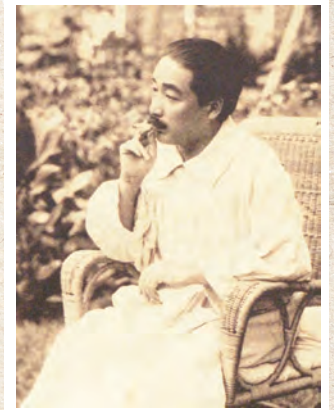
北原白秋肖像写真 昭和15（1940）年 国立国会図書館近代デジタルライブラリー （近代日本人の肖像より）