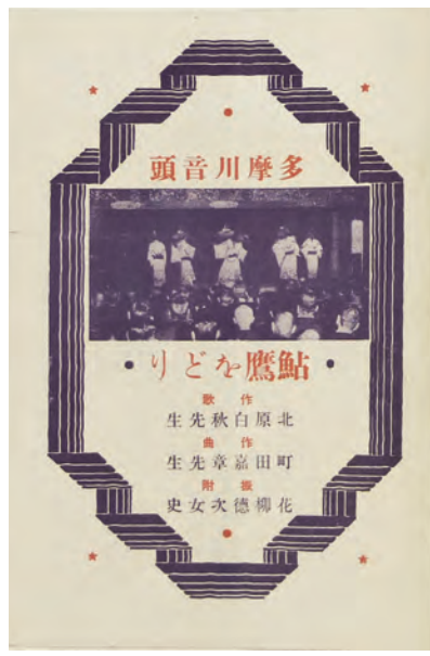
多摩川音頭楽譜（一部） 昭和4（1929）年 川崎市市民ミュージアム所蔵

川崎市市民ミュージアムは、令和2年度に、北原白秋が作詞した新民謡『多摩川音頭』の自筆原稿を新たに収蔵しました。新民謡とは、大正初期から昭和初期にかけて、地域おこしのために全国各地で盛んに作られた「ご当地ソング」です。『多摩川音頭』は当時の稲田村（現・川崎市多摩区）の青年団が中心となり制作されました。 本展では、全国に新民謡が普及していった背景や『多摩川音頭』をはじめとする新民謡が川崎地域に伝播していった過程を約30点の資料画像とともに紹介します。