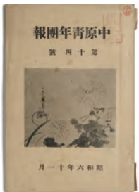
中原青年団報 昭和6（1931）年