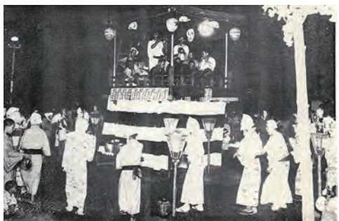
中原青年団の盆踊り 昭和8（1933）年

本展は川崎市市民ミュージアム Web サイト内の「the 3rd Area of "C" -3つめのミュージアム-」でご覧いただけます