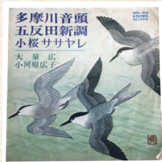
多摩川音頭レコードジャケット（新録版） 昭和40年代 川崎市市民ミュージアム所蔵