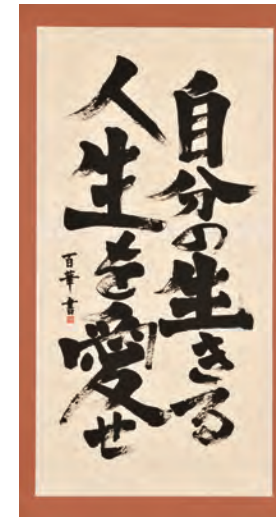
コミュゼ川崎大賞 書作品 《自分の生きる人生を愛せ》 谷口 百華