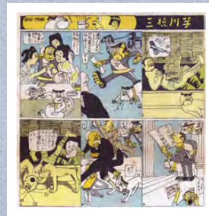
日本初のアニメーションの原作になったと考えられる漫画「芋川椋三」(『東京パック』大正4(1915)年)

これを皮切りに他社もアニメ制作に参入、競うように作品が作られ、日本のアニメ産業は黎明を迎えます。しかし、この時作られた作品はほとんど現存していません。はたして100年以上昔に作られたアニメはどのような作品だったのか、知られざる日本の初期アニメーションの全貌に迫ります。