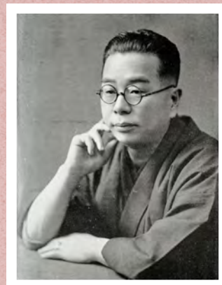
佐藤惣之助肖像写真

「赤城の子守唄」「六甲おろし」などの作詞家として広く知られる佐藤惣之助は、明治23(1890)年に現在の川崎信用金庫本店付近にあった川崎宿本陣の家に生まれました。大正4(1915)年に初めての詩集を出版し、以降、詩集17冊、随筆集12冊、ほか釣りに関する著作集7冊、発句集2冊を残しています。本講座では、文学活動のほかにも、釣りや旅を愛し、沖縄、南洋、オホーツクを巡り、飛行機にもいち早く乗り込んだ惣之助の人物像に触れながら、その足跡をたどります。