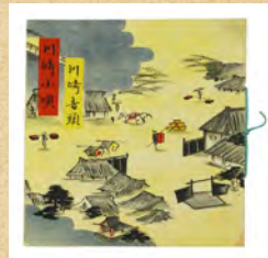
川崎音頭・川崎小唄パンフレット