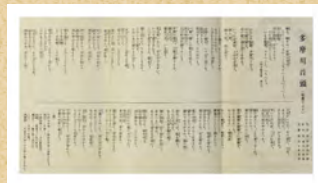
多摩川音頭パンフレット(裏面・部分)

7月28日(金)よりオンライン展覧会を同時開催！市民ミュージアムのWebサイトにてご覧いただけます。