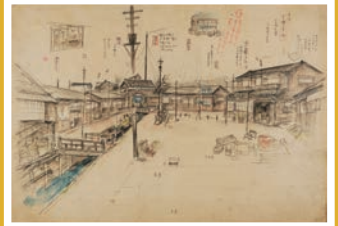
久保一雄『太陽のない街』映画セットのデッサン