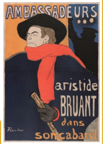
アンリ・ド・トゥールーズ=ロートレック 『アンバサドールのアリスティード・ブリュアン』 (1892年)