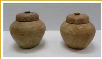
古墓出土火葬骨磁器(管生古墓群長沢1822 番地)