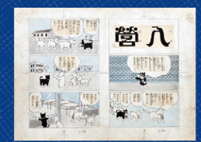
田河水泡「入道」原画 〔のらくろ上等兵〕収録 1932年 講談社蔵 ©田河水泡/講談社

1899年2月10日-1989年12月12日 本名:高見澤伸太郎。1922年日本美術学校入学、前衛芸術に傾倒し「マヴナ」に参加。生活のため、創作落語を大日本雄弁会講談社に持ち込んだことで作家となり、絵も描けることから次第にマンガも頼まれるようになる。雑誌に発表したマンガをまとめた「漫画の雑話」(大日本雄弁会講談社、1930)などで一躍人気漫画家となった。1931年には「のらくろ」の連載が始まり、戦前のマンガを代表する空前の大ヒット作となる。