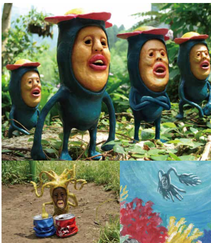
上:『こびと大百科』より リトルハナガシラ、左:『こびと観察入門』より パイプスマダラ、 右:『こびと大図鑑』より オトヒメノハゴロモ、表面:『こびと桃がたり』より

本展では、「こびとづかん」シリーズの原画やスケッチ、フィギュアのほか、絵画や映像作品などをご紹介します、なばたの仕事の足跡をたどります。書籍だけでは感じきれない力強さや緻密さ、そして独自の世界観を、ぜひお楽しみください。