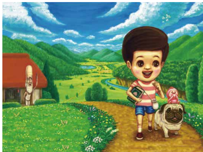
『こびと桃がたり』より