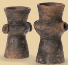
左上 | 《銅鐃》雲出川下流域遺跡群(三重県津市・松阪市) 弥生時代 右上 | 《異形台付土器》特別史跡 加曾利貝塚(千葉県千葉市) 縄文時代 下左 | 《人物埴輪》神田・三本木古墳群(群馬県藤岡市) 古墳時代