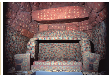
左 | 《骨蔵器(レブリカ)》有馬入山古墓(神奈川県川崎市)奈良時代 川崎市教育委員会蔵 右 | 《王塚玄室》特別史跡 王塚古墳(福岡県嘉穂郡桂川町)