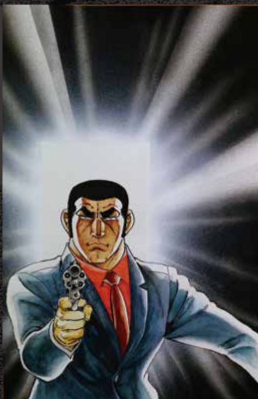
「アームストロングの遺言 前編」