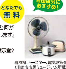
扇風機、トースター、電気炊飯器 (川崎市市民ミュージアム所蔵)