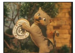
『もりのおんがくたい』

対象：当日に《いろいろな動物の映画》を鑑賞されたお子様とその保護者 参加無料／事前申込不要／所要時間はそれぞれ約 10～15 分間程度