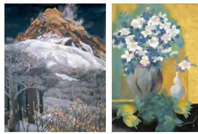
《昭和新山》1975年 《華やき》2014年