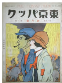
下川凹天 「銀座はうつる」 『東京パック』 (18巻1号)1929年

日時 11月19日(日)13:30~16:00 会場 3Fミニホール 定員 40名(当日先着順・途中入場可能)