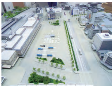
1963年頃の川崎駅前を再現したジオラマ

日時 10月9日(月・祝)・11月5日(日)・12月3日(日) 各日14:00~16:00 会場 3Fミュージアムギャラリー2 定員 40名(当日先着順) 監修 フェリス女子学院大学教授 春木良且