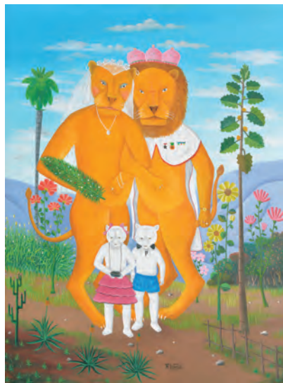
フィルトン・ラトルチュール 《狼の子を連れて散歩するライオンのカップル》 個人蔵