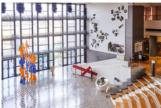
▲開会式会場 1F 逍遙展示空間

・ヴァスコ・バッシレフ(Vasko Vassilev)/ヴァイオリニスト(ロンドン最高地位のコンサートマスターであるコヴェントガーデン・ロイヤルオペラ管弦楽団の第1ソロコンサートマスター)