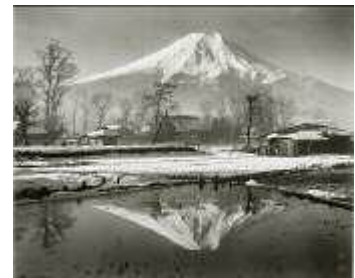
岡田紅陽「富士 倒影 忍野」1950年