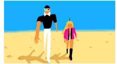
ぬQ «ニュー〜東京音頭» 2012年

会期中には作品の展示のほか、参加型ワークショップやイベントも多数展開し、作家と美術館、美術館と来場者、作家と来場者、作品と場など、様々な「&」に焦点をあてながら、今日の芸術のあり様を映し出します。