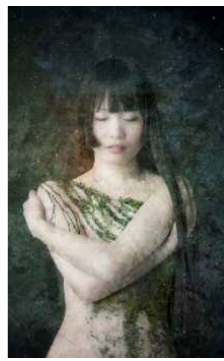
桑田恵里 «共生／侵蝕» 2013年