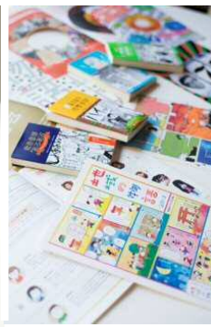
アベキヒロカズ «works ~2013» 2013年