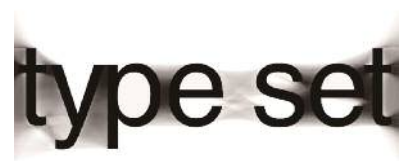
大原崇嘉 «Numerics» 2012年