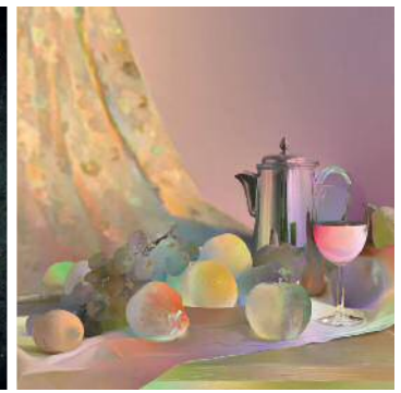
柳川智之+大原崇嘉 «Valeur (Color Conversion)» 2015年

会 期：2016年8月4日（木）～2016年9月25日（日） 会 場：川崎市市民ミュージアム アートギャラリー1・2・3 開館時間：9：30～17：00（入館は16：30まで） 休 館 日：毎週月曜日（9月19日は開館）、8月12日（金）、9月20日（火）、9月23日（金） 観 覧 料：一般300円、大学生・高校生・65歳以上200円、中学生以下無料 ※20名以上の団体は2割引 主 催：川崎市市民ミュージアム