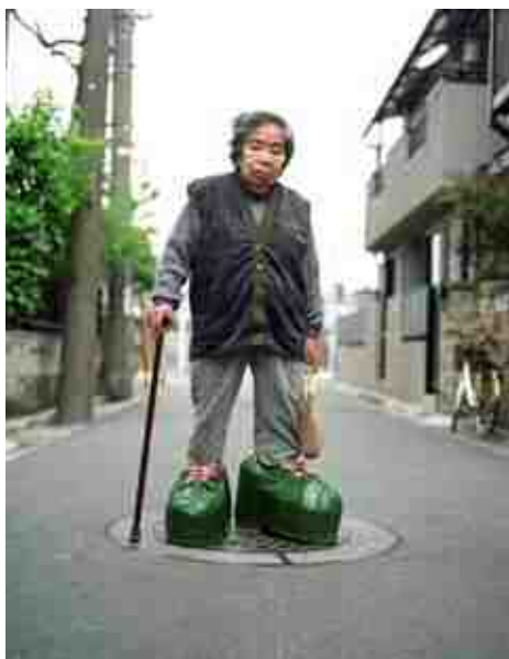
表面:アート・ママ+息子 2008年 上:パン人間の息子+アルツハイマー・ママ 1996年 下:スモール・ママ+ビッグ・シューズ 1997年