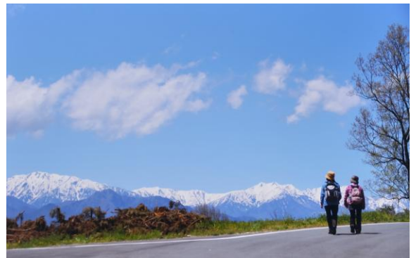
特選 早春の安曇野<写真> 植木 清吉