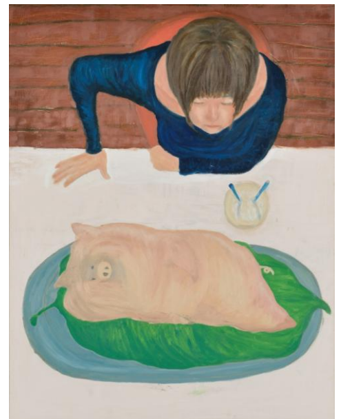
ヤング大賞 要らない<中高生> 木村 穂乃香