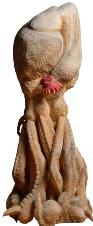
特選 木のように立つ。<彫刻・立体造形> 戸塚 くるみ