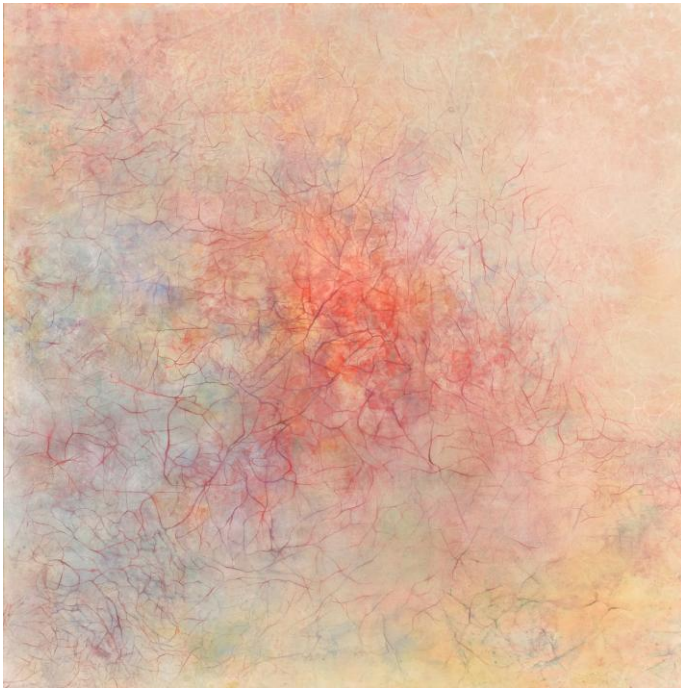
最優秀賞 体温<平面(日本画)> 川副 麻里子